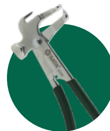
Acompanha Alicete para Balanceamento SATA®.